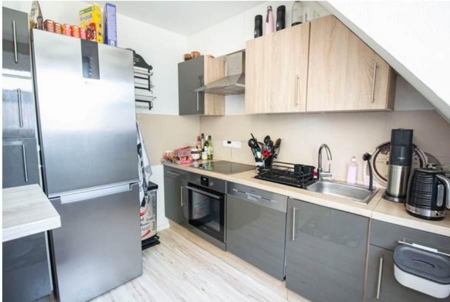
Küche mit EBK